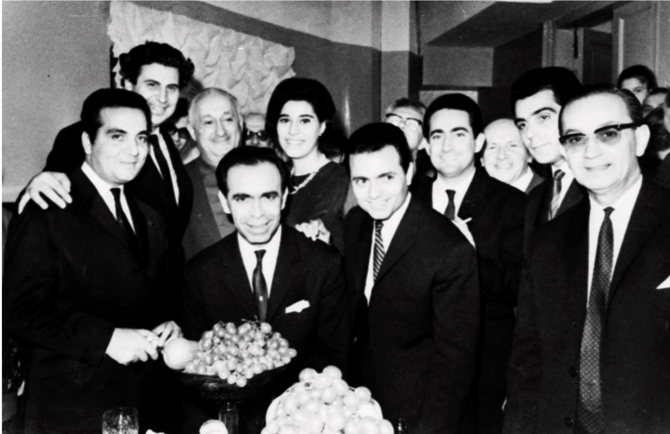
Φθινόπωρο του 1966. Συναυλίες στην Σοβιετική Ένωση.

Βέβαια είχε την κούρασή του γιατί ταξιδεύαμε πάρα πολύ, αλλά ήμασταν νέοι, δυνάμεις είχαμε και τα καταφέραμε.