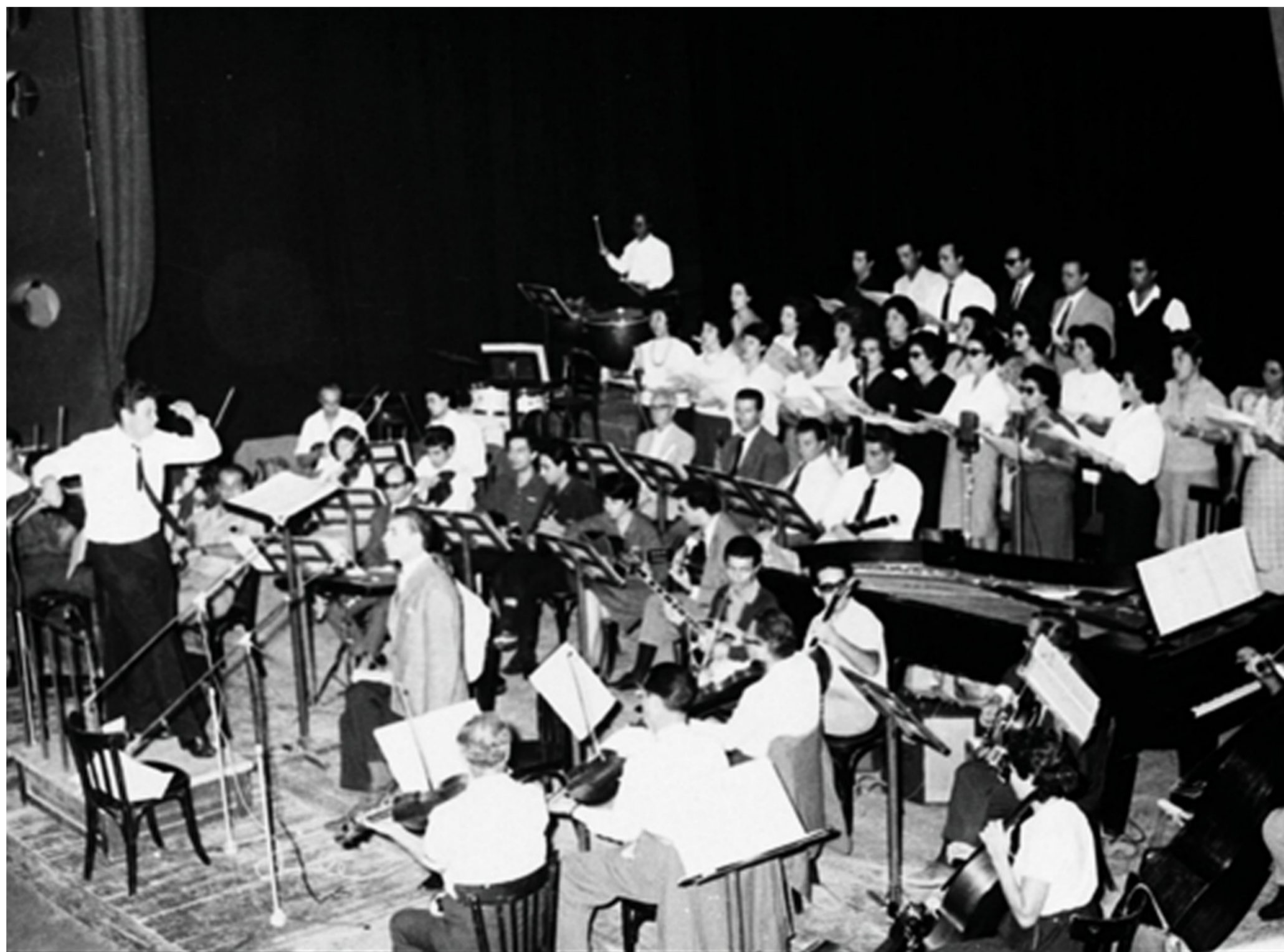
Πρόβα για το «Άξιον Εστί» στο Θέατρο REX, 18/10/1964

Καταλαβαίνατε ότι συμμετείχατε σε κάτι τόσο μεγάλο;