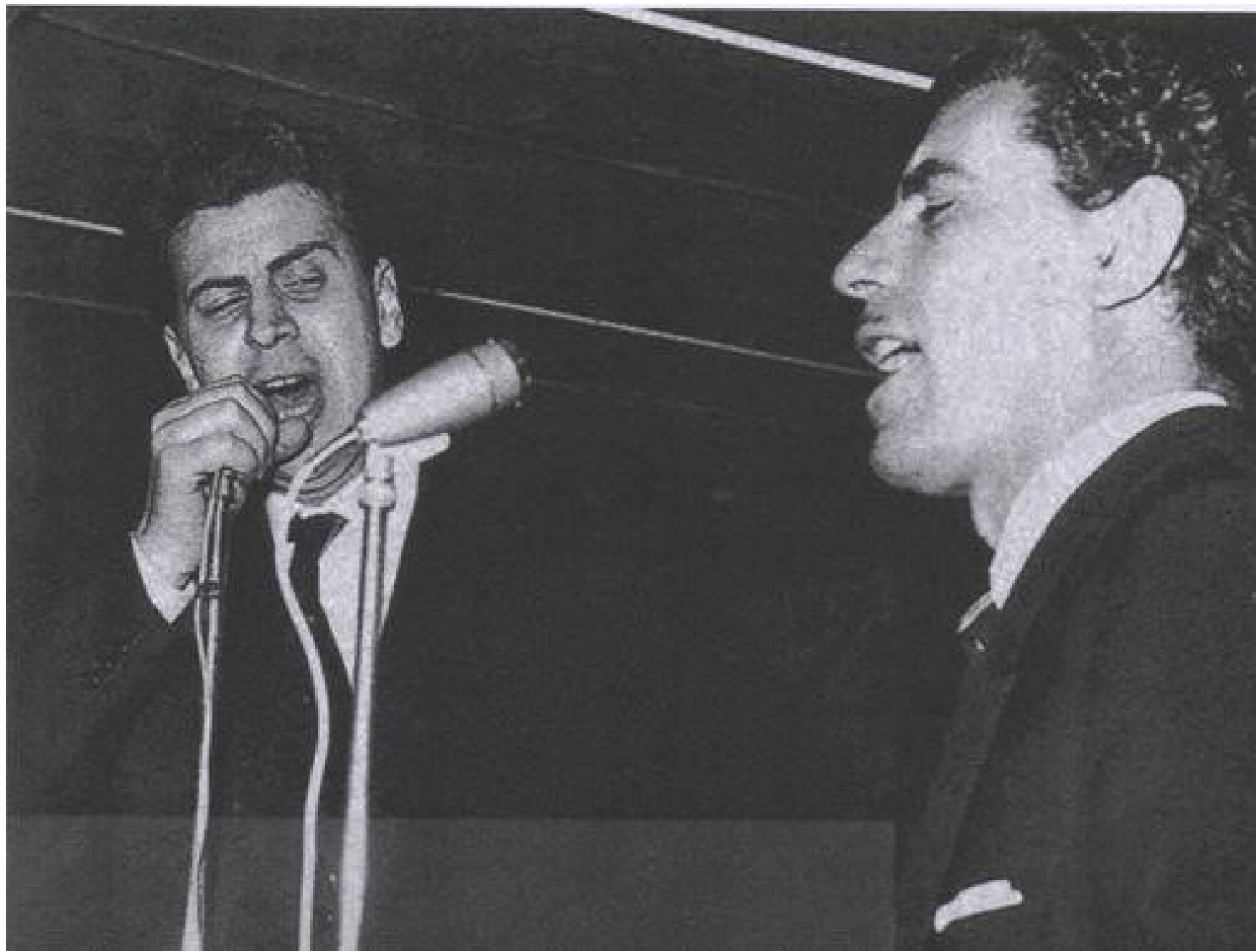
Ο Μίκης Θεοδωράκης μαζί με τον Γρηγόρη Μπιθικώτση, στη Νάουσα, στον κινηματογράφο «ΑΓΓΕΛΙΚΑ»