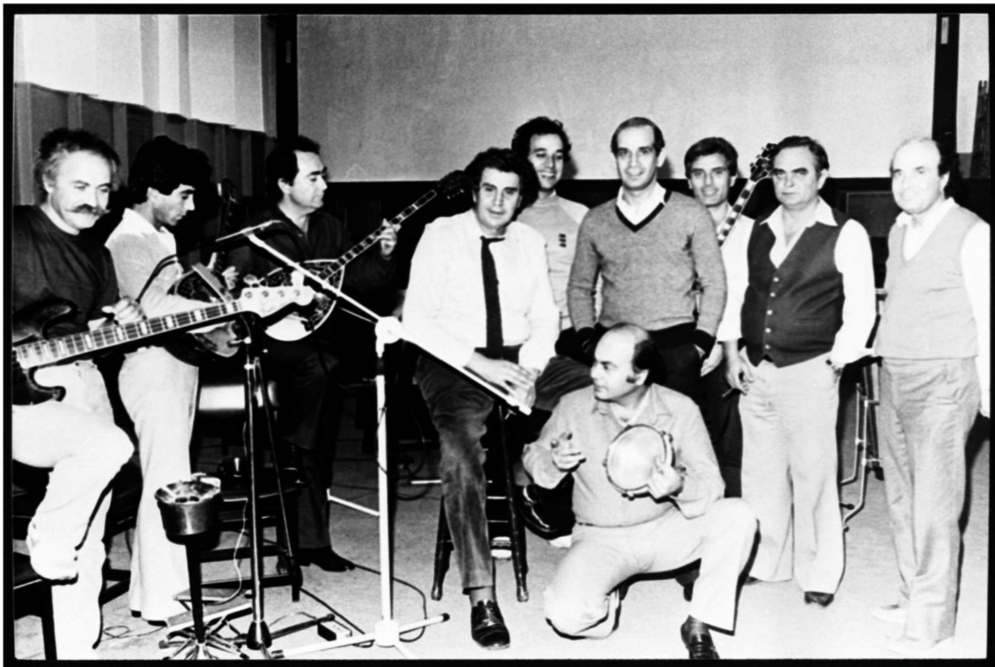
Ηχογράφηση του δίσκου «Πικροσάββατα», 1984

του μας πήγαινε εκεί. Και μία φορά μας είπε: «Γιατί δε μου γράφετε σ' ένα μαγνητόφωνο τους δρόμους να τους εμπεδώσω;». «Ναι, θα το κάνουμε Μίκη», του λέγαμε αλλά εμείς το ξεχνάγαμε, το αφήσαμε. Τελικά, έβαλε τους εφτά - οχτώ «δρόμους» σε μία κασέτα ο Χρήστος Νικολόπουλος - την περίοδο που είχαν μια γρήγορη συνεργασία με τον Γιώργο Νταλάρα - και του την έδωσε. Έτσι τους γνώρισε. Από τον καιρό όμως που τους γνώρισε, μας παιδεψε. Στον «Διώνυσο», εκτός από έναν τσεκαρισμένο «δρόμο» που υπάρχει και είναι «Σαμπάχ», που παίζεις «ρε ματζόρε» και «φα μινόρε», αυτός το έκανε και σε ανάπτυξη με άλλες συγχορδίες. Στο τραγούδι «Μια φυλακή» θα δείτε ότι είναι λαβύρινθος! «Τραβηχτήκαμε» πολύ για να τα βγάλουμε πέρα αυτά. Ήταν σουρεαλιστικό το παίξιμο!