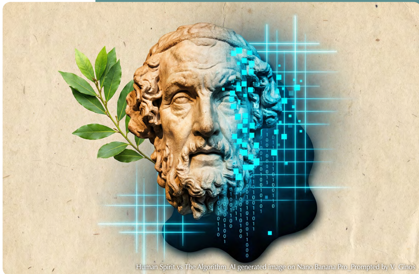
Human Spirit vs The Algorithm_AI generated image on Nano Banana Pro_Prompted by V. Cinos